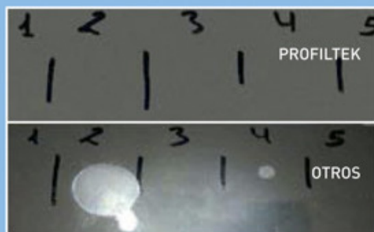
> ENSAYOS EN ACABADO CROMO BRILLO

Se compara una muestra de perfil de aluminio cromado que utilizamos habitualmente en Profiltek con otra muestra de las mismas características de un fabricante NO homologado.